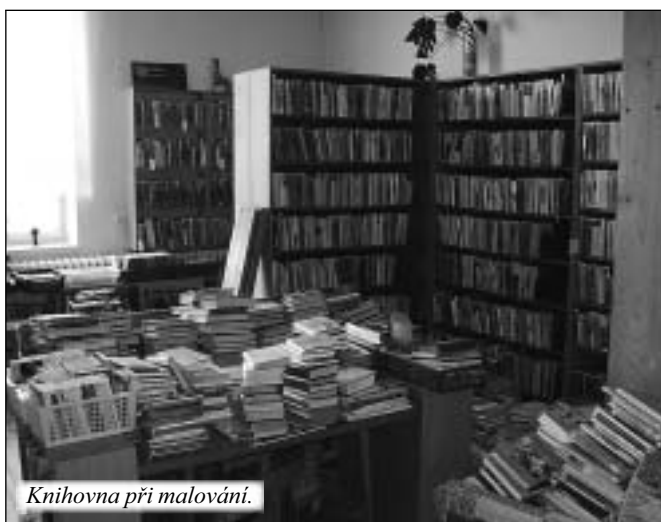
Knihovna při malování.